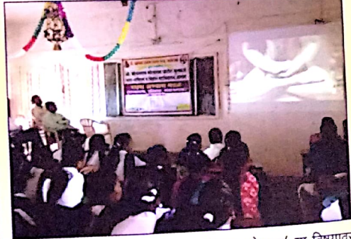
इतिहास विभागाद्वारे आयोजित 'इतिहास योगाचा' या विषयावर कार्यशाळा