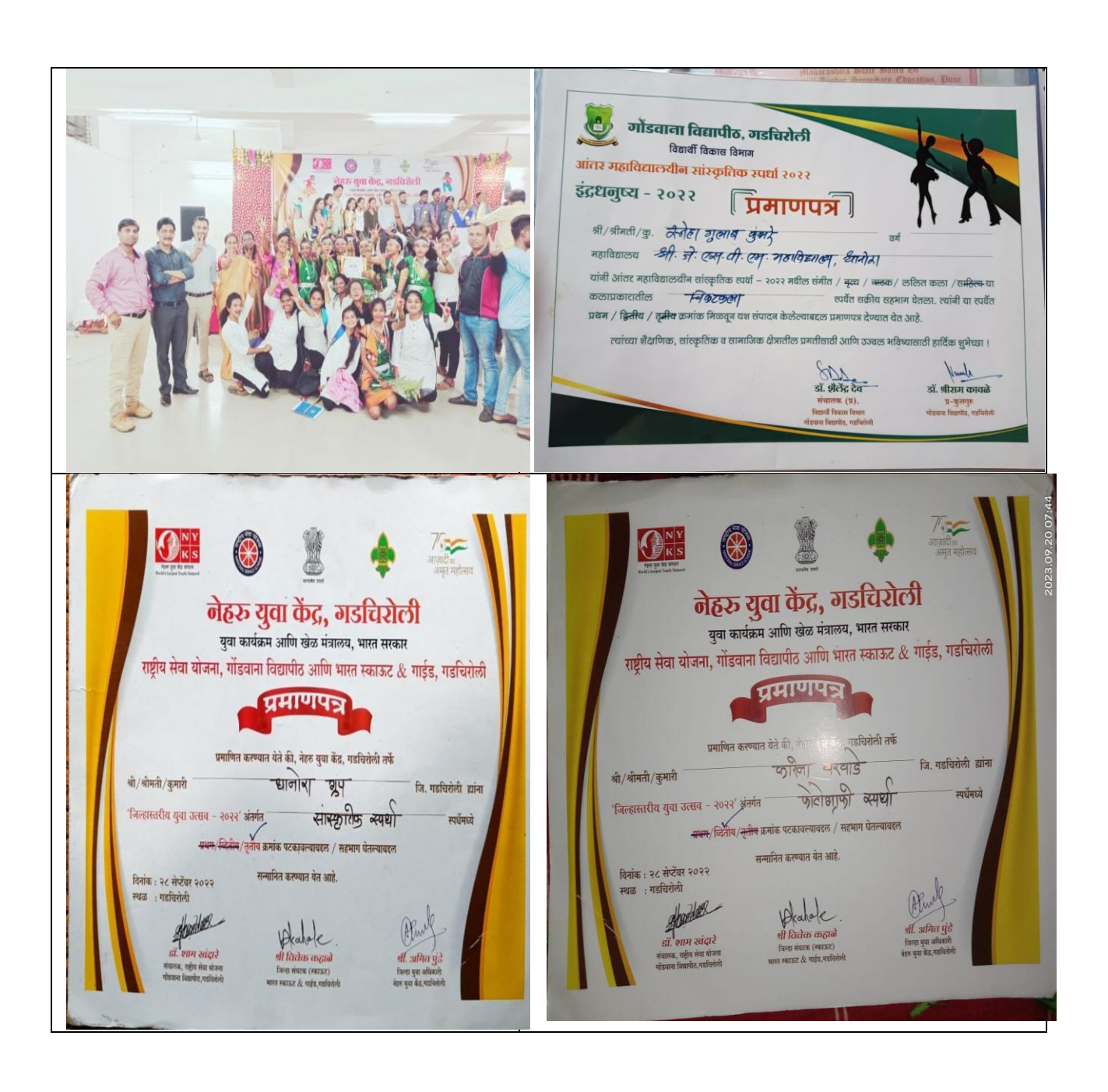
Certificates for intelligence in various competitions