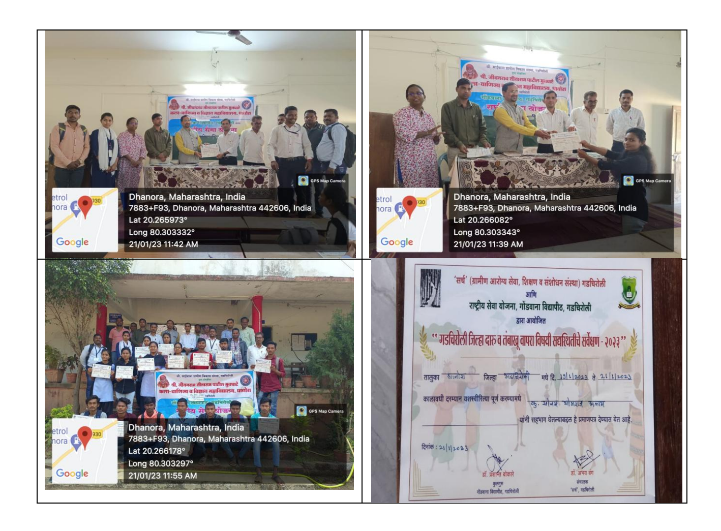
Survey of Tobacco and Alcohol Consumption jointly organized by NSS Unit and SEARCH Team